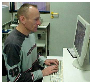
ERP de Lyon

Les militaires profitent de la grande diversité des formations des ERP et trouvent dans 95% des cas un emploi suite à leur cursus. Ils apprécient la qualité des enseignants, l'accueil des entreprises partenaires lors des stages et tous les efforts déployés pour faciliter l'accès à l'emploi et à la création d'entreprise.