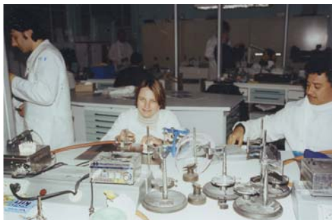
ERP de Limoges

Les ERP de l'ONAC proposent un large éventail de formations, reconnues par l'Education Nationale, allant du niveau V (CAP, BEP), IV (Bac Professionnel), III (BTS, DUT) jusqu'aux préparations aux concours de la fonction publique.